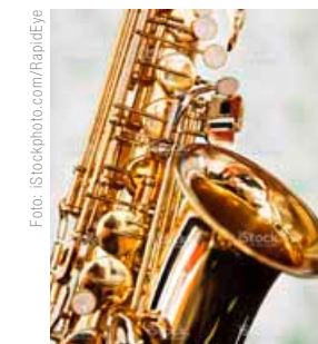
Jazz vom Feinsten.

UNTEN SEHEN SIE AUSSCHNITTE VON DREI FOTOS , DIE SICH AUCH IM INNENTEIL DIESES MAGAZINS WIEDERFINDEN. NOTIEREN SIE DIE DAZUGEHÖRIGEN SEITENZAHLEN UND ADDIEREN SIE DIESE. SENDEN SIE DIE SUMME BITTE BIS ZUM 18. SEPTEMBER 2015 AUF EINER POSTKARTE AN: